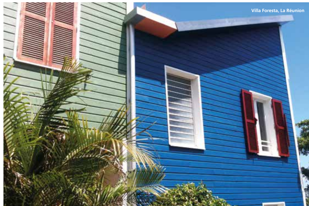
Villa Foresta, La Réunion