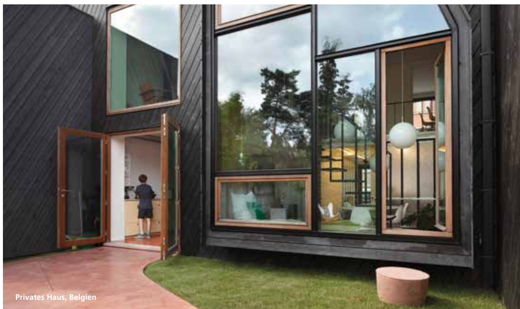
Privates Haus, Belgien