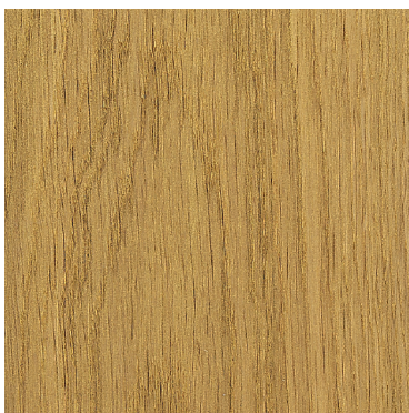
TOUCH OF GOLD

Die 7 Trendfarben sind ausschließlich mit B-Komponente zu verwenden.